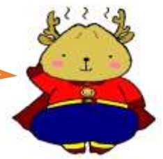
蘇峰児童センター公式キャラ 「しまん」

シールあそび、大好き! ナイロン袋やクリアーフォ ルダーに貼ってもおもしろ いよ!