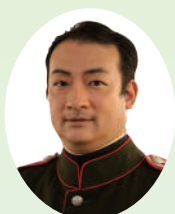
木下紀章 (テノール)