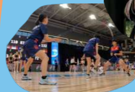
ダブルダッチ「びよん太」