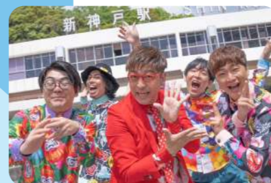
ワタナベ フラワー

このチラシを持って加古川駅に行くと、 キッズイベントに参加できるよ! (29日のみ)