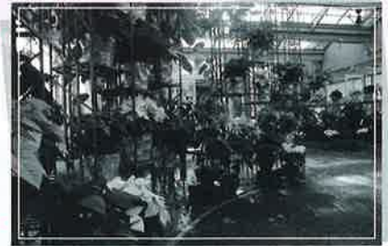
ポインセチアとスミシアンサ展