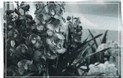
ウィンターセール