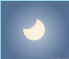
1月6日 部分日食 (明石) (ステラナビゲータで作図)

2019年は日本で2回の部分日食が見られるなど、注目の天文現象があります。また、毎年楽しみな流星群や惑星の見ごろなどをご紹介します。